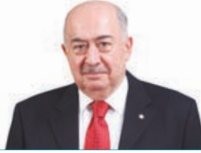
M. Tinas Titz Yönetim Kurulu Başkan Vekili (Bağımsız Üye)

Yönetim Kurulu'nda Görevde Bulunduğu Süre: 3 yıl