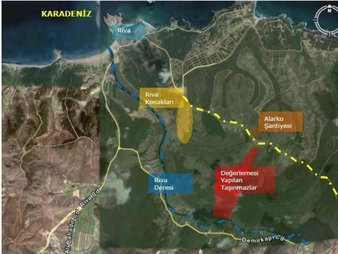
TAŞINMAZIN MERKEZLERE KUŞUÇUŞU UZAKLIKLARI

Coğrafi Koordinatları: Kuzey-41,198168° 29,248756°