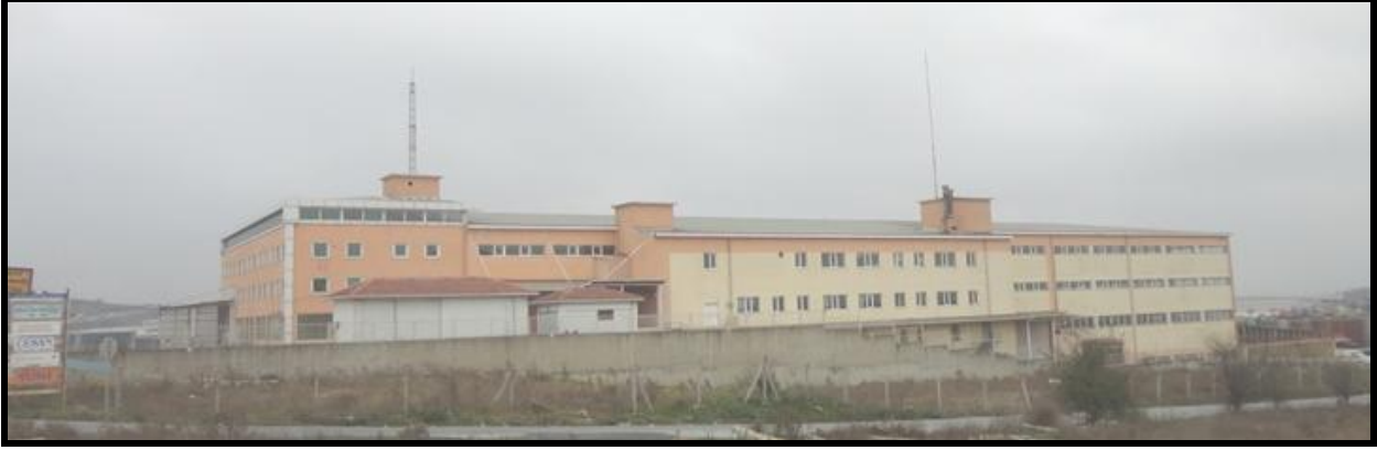
-Taşınmazın güneybatı cepheden görünüşü-

Değerlemeye konu taşınmaz İstanbul ili, Arnavutköy ilçesi, Ömerli Mahallesi, 113 ada 8 parsel üzerinde yer alan "B.A.K. İki Katlı Fabrika Binası" vasıflı gayrimenkul olup hâlihazırda boş durumdadır.