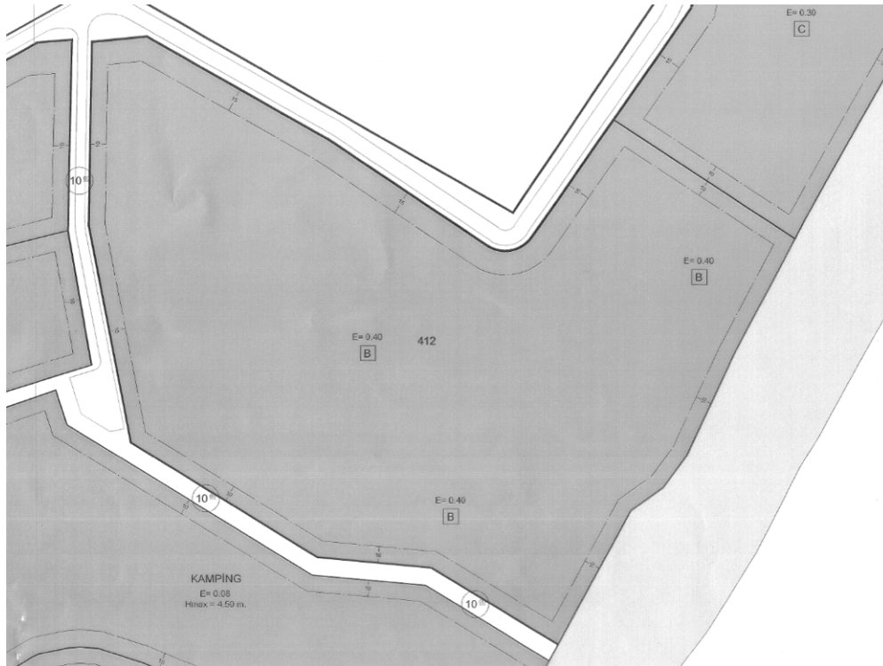
İmar Planı Örneği

Plan notlarına göre; B lejandı verilen alanlarda, tatil köyü olması halinde h_{max} : 13.50 m'dir. Otel olması halinde veya tatil köyü içinde yer alabilecek otel kitlesi için h_{max} : 18.50 m'dir (zemin kat + 4 yatak katı).