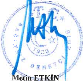
Metin ETKİN Sorumlu Denetçi