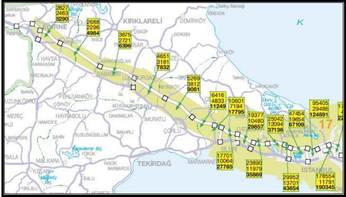
2008 YILI YILLIK ORTALAMA GÜNLÜK TRAFİK DEĞERLERİ (OTOYOL GIŞE SAYIMLARI)