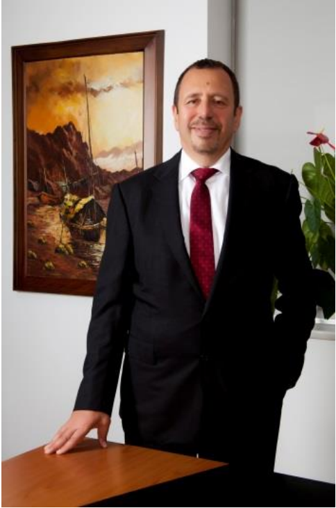
Polisan Holding CEO Erol Mizrahi

Polisan Holding olarak, 2014 yılının dokuz ayında, geçen yılın aynı dönemine kıyasla %34,3 oranında büyüyerek 619,6 milyon TL olan gelirlerimiz ile güçlü bir çeyreği daha geride bıraktık. Gelir büyümesinde en büyük pay, 93,8 milyon TL ile, bu sene gelir kaydetmeye başlayan Yunanistan'daki PET üreticisi operasyonumuz Polisan Hellas'ın oldu. Boya ve liman faaliyetlerimiz de, operasyonel karlılık ile büyüyen gelirleri ile bu başarıyı destekledi. Yine de, kurulum aşamasındaki Polisan Hellas'ın FAVÖK üzerinde 11 milyon TL'lik bir etkisi oldu ve diğer operasyonlardaki döviz bazlı maliyetler dolayısıyla da, FAVÖK marjı toplamda 3,8 b.p.'lik etki ile %13,8 seviyesinde gerçekleşti. Net kar ise, Polisan Hellas'ın 14,0 milyon TL'lik negatif etkisi ve Polisan Kimya'daki kur bazlı borçların artan maliyeti ile geçen yıla kıyasla %32,6 oranında düştü ve 20,0 milyon TL olarak gerçekleşti.