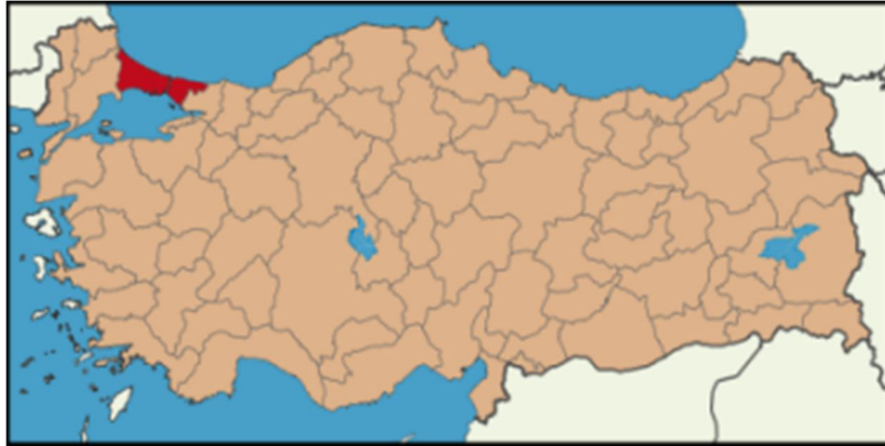
Harita 1 - İstanbul İli Konumu

Ülkenin finans merkezi olan İstanbul'un nüfusu 13 milyonun üzerinde olup, bu rakam artmaya devam etmektedir. Adrese Dayalı nüfus Kayıt Sistemi verilerine göre İstanbul İli'nin 2013 yılı toplam nüfusu 14.160.467 kişi olup ülke nüfusu içerisinde %18'lik orana sahiptir. İkinci en büyük şehir olan Ankara'dan yaklaşık üç kat fazla nüfusa sahip olan şehir, ülkenin kentleşme sürecinin de ana odağı olmuştur. Konut ihtiyacının en belirgin olduğu şehir olan İstanbul yeterli ve kaliteli konut temininde ciddi sorunlar yaşamaktadır. Sonuç olarak, kent dışında devlet ve özel yatırımcılar tarafından yeni toplu konutlar yapılmakta, şehrin Avrupa Yakası'nda gelişme şehri merkezinin batısından bu kent dışı alanlara doğru kaymaktadır.