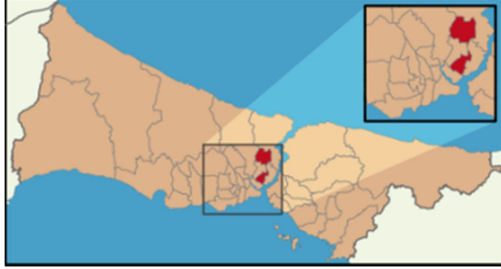
Harita 2 – Şişli İlçesi Konumu

İstanbul'un merkezinde yer alan Şişli güneyinde Beyoğlu, doğusunda Beşiktaş, kuzeyinde ve batısında Kağıthane ilçeleri ile çevrilidir. Şişli çok çeşitlilik gösteren bir bölge olup, her sınıftan ofis binasını, yeni karma projeleri, alışveriş merkezlerini, konut bölgelerini, beş yıldızlı otelleri ve konferans merkezlerini bünyesinde barındırmaktadır. İlçe kuzeyde Mecidiyeköy ve Zincirlikuyu üzerinden Ayazağa'ya da içine alarak Sarıyer'e, kuzeybatıda ise Hürriyet-i Ebediye Tepesi üzerinden Kağıthane'ye kadar geniş bir alana yayılır. Adrese Dayalı Nüfus Kayıt Sistemi verilerine göre ilçenin 2013 yılı nüfusu 274.420 kişidir ve toplam yüzölçümü 30 km 2 olan ilçe idari olarak 28 mahalleden oluşmaktadır.