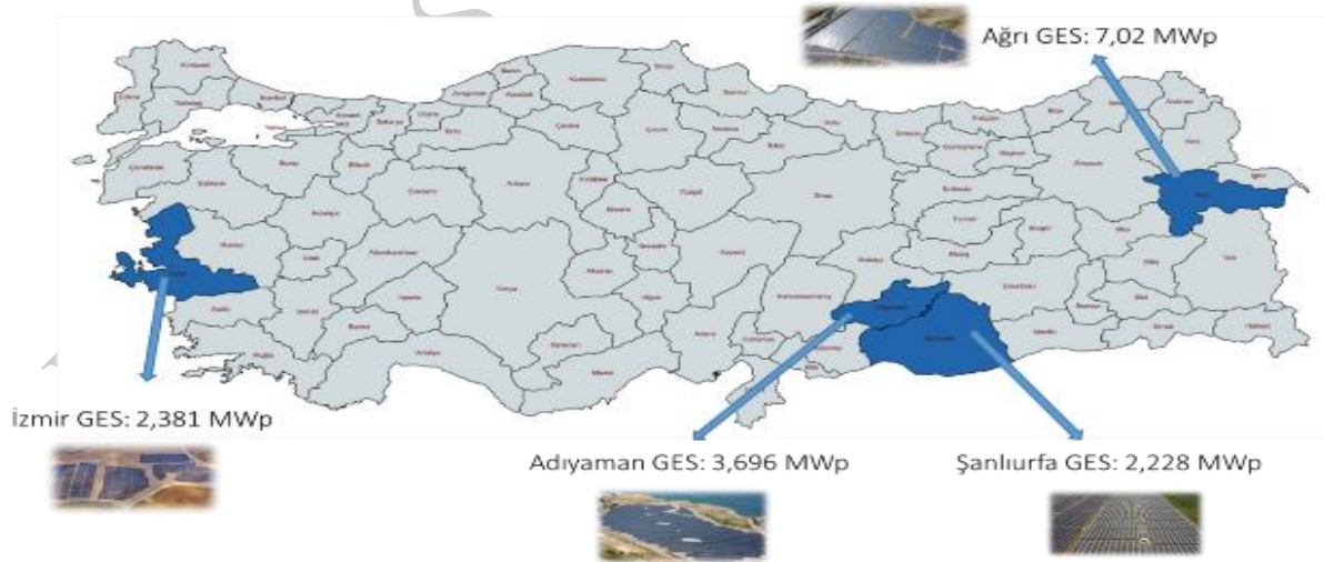
SOHO Enerji GES sahaları