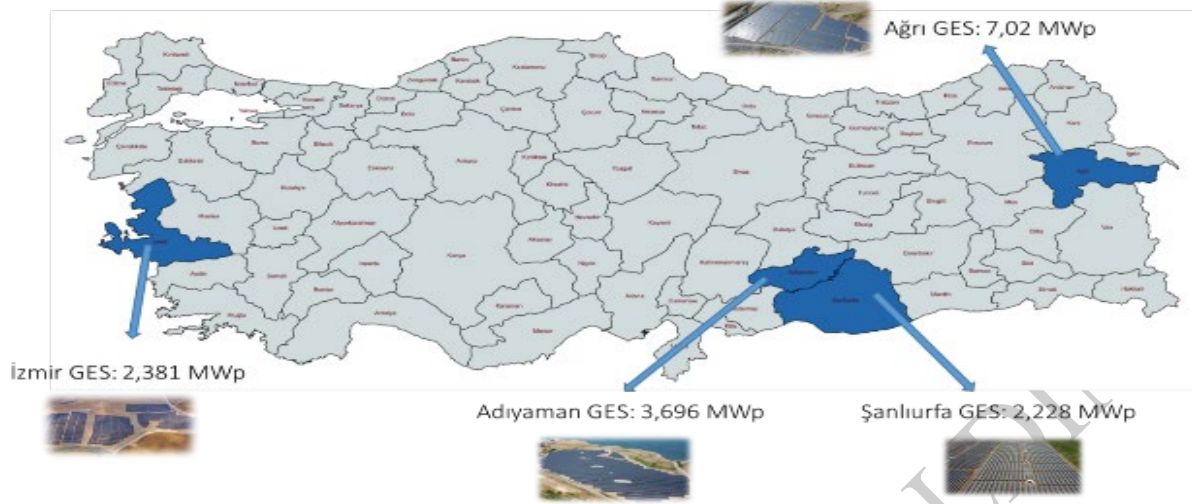
SOHO Enerji GES sahaları