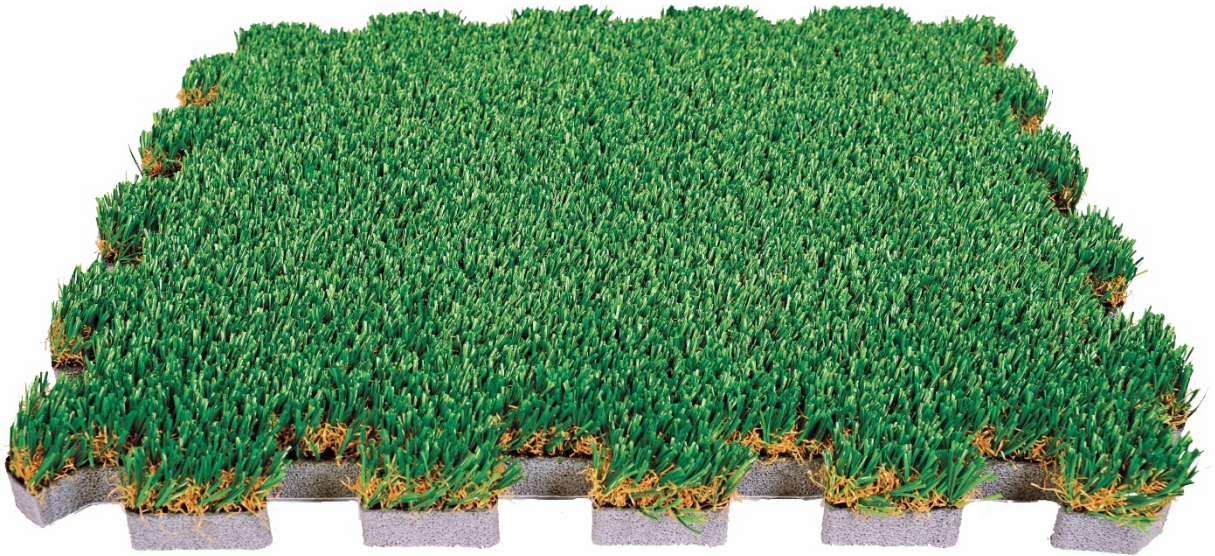
FOAMEX ÇİM PUZZLE

BERKOSAN yeni yatırımlarıyla birlikte yüksek katma değerli, çevreye ve insan sağlığına duyarlı süreçlerde özel ürünler geliştirmekte ve üretmekte, üretimlerimiz CE Belgesi ile Avrupa standartlarında sürdürülmektedir.