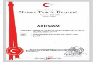
AIRFOAM Marka Tescil Belgesi