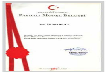
Faydalı Model III Belgesi