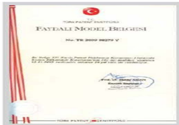
Faydalı Model II Belgesi