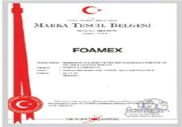
FoameX Marka Tescil Belgesi