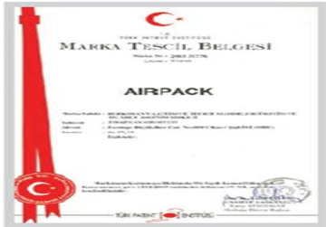
AIRPACK Marka Tescil Belgesi