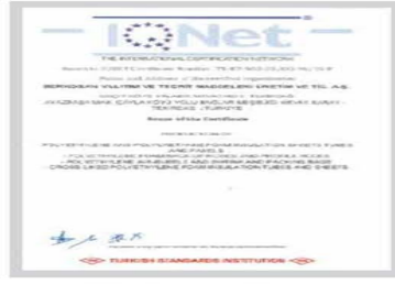
BR BERKOSAN Net Certificate