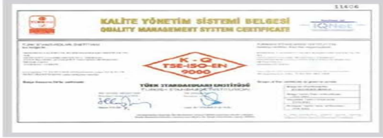
BR BERKOSAN Kalite Yönetim Sistemi Belgesi