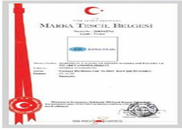
BR BERKOSAN Marka Tescil Belgesi