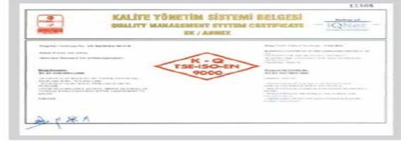
BR BERKOSAN Kalite Yönetim Sistemi Belgesi Ek