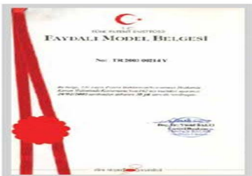
Faydalı Model I Belgesi