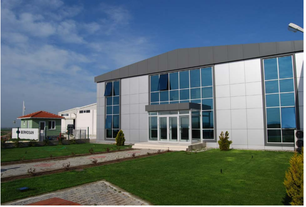
Berkosan Bozüyük Fabrika