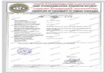
FoameX TSE Belgesi