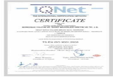
BR BERKOSAN Net Certificate