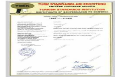
POLYBERK TSEK Belgesi