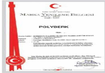
POLYBERK Marka Tescil Belgesi